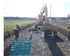
円形水路（雨水処理）