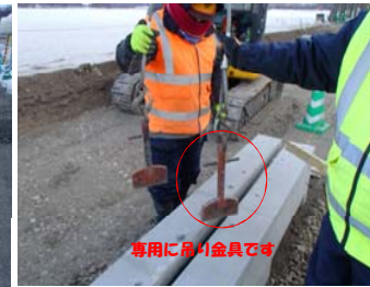
専用に用いた金具です