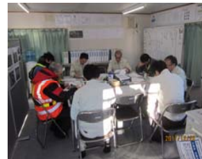
協力していただいている業者の方々です