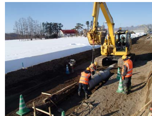
雪が降った後の施工状況

冬期施工における配慮事項として 雪が降る予報には 前日に「除雪シート」 を使用しています。