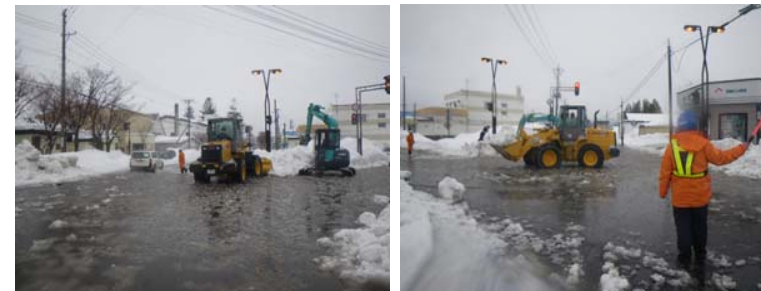
鹿追町立鹿追小学校にて児童通学路の確保