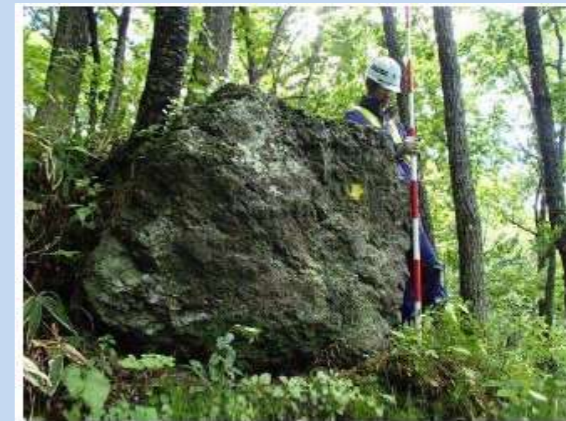
(例) 道路際の斜面にある 転げ落ちそうな石

事務所にAEDを設置しました。 いつでも使用可能です。(緊急時の際は、連絡下さい) 連絡先 090-8636-2171(24時間対応)