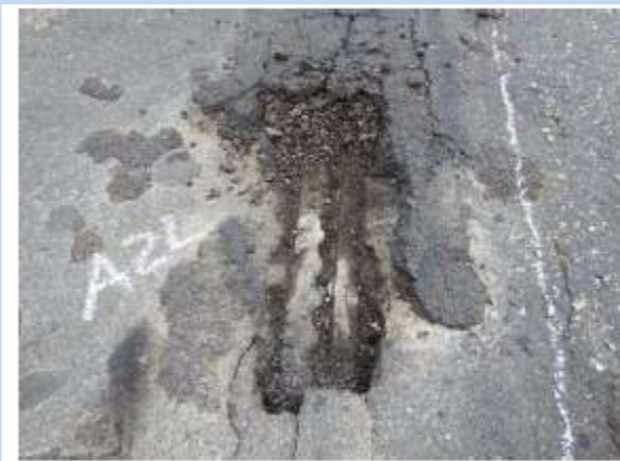
(例) 橋のつなぎ部分(伸縮目地)破損状況