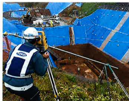
橋台の位置出し測量状況