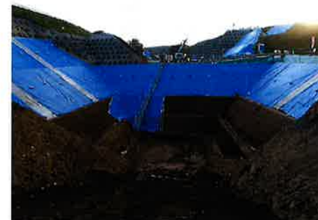
A2橋台床掘完了状況

年末も近づき追込み作業期間に入りましたが、労働災害が起きない様に、安全に工夫を凝らして日々仕事を行っています。