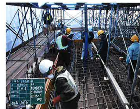
橋台の底板部分、打設状況