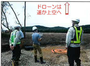
ドローンによる写真測量