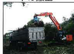
集めた木を処理場へ運搬