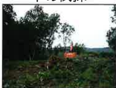
現場内の木を切る