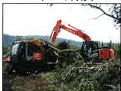
切った木を集める