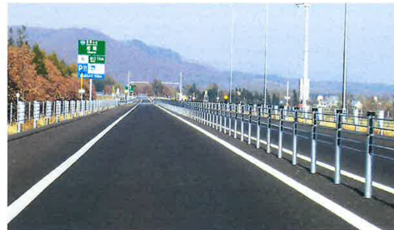
写真1 帯広広尾自動車道 中札内大樹道路