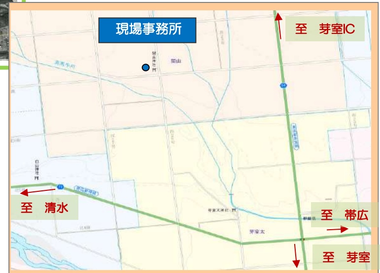
【 現場事務所詳細地図 】

工事名 畑地帯芽室北第3外1地区72工区 工期 令和5年5月24日～令和6年1月30日 発注者 十勝総合振興局 南部耕地出張所 施工者 徳井・サクシン経常建設共同企業体 現場代理人 小濱 由浩 連絡先携帯 [REDACTED] 現場事務所 芽室町祥栄北7線39番地2 アドレス [REDACTED]